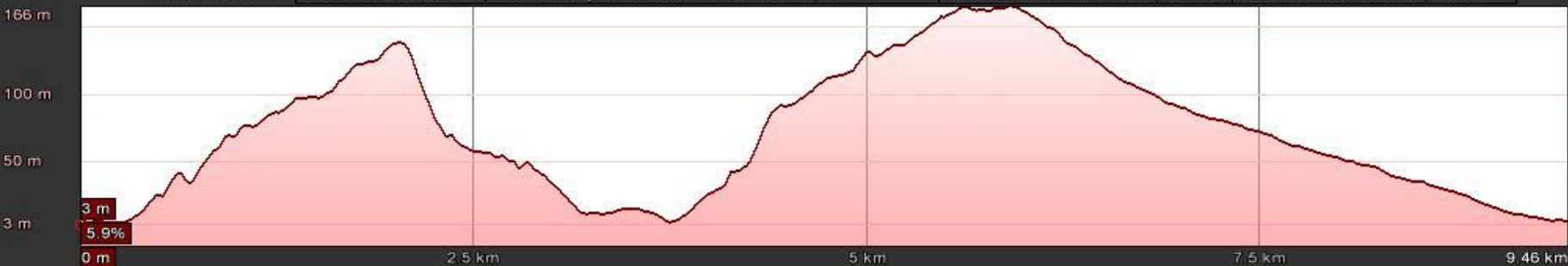
Gráfico: min., media, máx. Elevación: 3, 72, 166 m Total de intervalo: Distancia: 9.46 km Incremento/pérdida de elevación: 337 m, -335 m Pendiente máxima: 29.9%, -32.5% Pendiente media: 7.9%, -5.9%

Fecha de las imágenes: 2/22/2016 37°04'33.97" N 1°51'49.87" O elev. 104 m alt. ojo 4.51 km