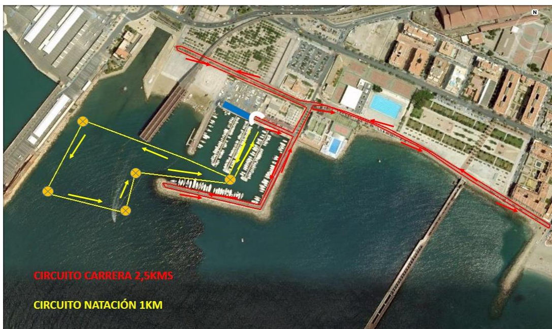
DETALLE CIRCUITOS I ACUATLÓN CIUDAD DE ALMERIA