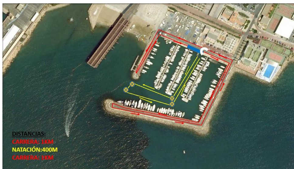
CIRCUITO CATEGORÍA INFANTIL